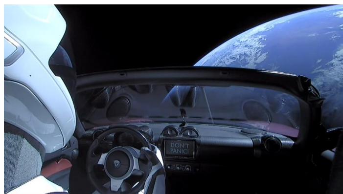
2. ábra Elon Musk Teslája az űrben 2